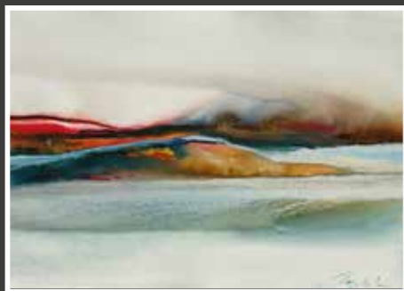
12 Živko Toplak: Obala, akvarel-papir, 40x60 cm, poklon autora, 1.800,00 kn

Još jedan majstor akvarela, Živko Toplak iz Varaždina, inače stalni donator ove humanitarne akcije, demonstrira lakoću svoga kistovnog postupka, kontrolu u opisu pejzaža, ali i slobodno širenje akvarelne mrlje, a sve skupa kreativno izvedeno do najviše poetske razine.