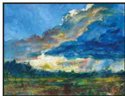
17 Zlatko Kauzlarić-Atač: Nebo nad Podravinom, akril-papir, 63x83 cm, 2021. poklon autora, 4.000,00 kn

Zanimljiva slika na granici između realnosti i fantazije, izvedena u rafiniranom tonskom odnosu i s preciznim crtežom, sa sadržajem koji se referira na velikog nadrealističkog slikara Magritta.