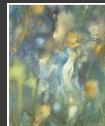
11 Ivan Andrašić: Akt u pejzažu, akvarel-papir, 52x41 cm, 2021., poklon autora, 2.000,00 kn Na akvarelu akta u prirodi Andrašić spaja svoja dva dominantna stilska, tematska i morfološka opredjeljenja (pejzaž i žena, realno i apstraktno, stvarno i imaginarno, zgnusnuto i raspršeno) u sineznu kompoziciju fine poetičnosti i senzualnosti.