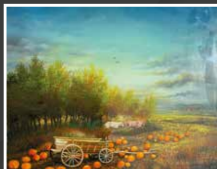
4 Mirko Horvat: Na polju, ulje-staklo, 45x55 cm, 2016., poklon autora, 2.200,00 kn Horvat, jedan od posljednjih autentičnih naivnih slikara Podravine, poklonio je vrijedan rad, s motivikom, stilom, koloritom i ugodajem koji su tipični za ukupni njegov opus koji, usput rečeno, traje već više od 50 godina.