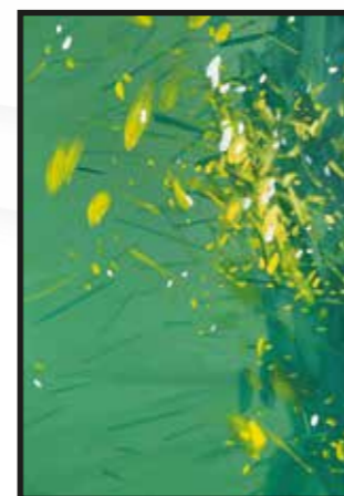
7 Darko Markić: Landscape, ulje-platno, 50x70 cm, 2021., poklon autora, 2.800,00 kn Rad je izdvojen iz serije koju koprivnički akademski slikar radi u posljednje vrijeme, a posvećena je prirodi, drveću, ekologiji, no bez opisnih namjera i realnih atributa, s intencijom ostvarenja čistog vizualnog i poetskog doživljaja.