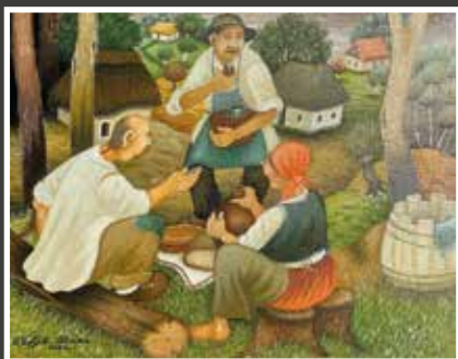
13 Pero Topljak: Ručak, ulje-drvo, 35x44 cm, 2020., poklon autora, 2.000,00 kn

Još jedan majstor akvarela, Živko Toplak iz Varaždina, inače stalni donator ove humanitarne akcije, demonstrira lakoću svoga kistovnog postupka, kontrolu u opisu pejzaža, ali i slobodno širenje akvarelne mrlje, a sve skupa kreativno izvedeno do najviše poetske razine.