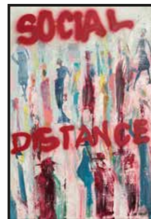
6 Tihomir Hrenek: Social distance, komb. tehnika-platno, 100x70 cm, 2020., poklon autora, 1.600,00 kn Ovaj koprivnički slikar-autodidakt sa zagrebačkom adresom, poklonio je rad s aktualnom temom, ostvaren u znalačkoj sintezi klasičnog ekspresivnog postupka i grafiti-arta.