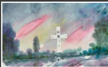
2 Franjo Mihočka, akvarel-papir, 33x51 cm, 2021., poklon autora, 1.000,00 kn Đurđevački likovni entuzijast i slikar poklanja akvarel na kome se prožimaju simbolički elementi s poetiziranom prirodom, slikanje podravskog pejzaža s vizijom sakralnog znaka.