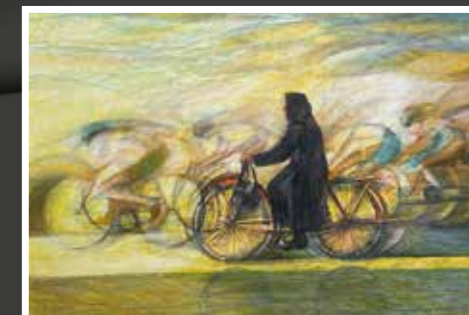
10 Zdravko Šabarić: Utrka, uljeni pastel-papir, 50x70 cm, 2018., poklon autora, 1.600,00 kn Omiljeni motiv poznatog đurđevačkog slikara su prizori u kojima se kontrastira staro i novo, što je u seriji o biciklima i biciklistima donešeno posebno uvjerljivo u simboličkom i likovnom smislu.