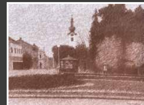
9 Dražen Eisenbeisser: Koprivnica, suhi pastel, olovka-papir, 51x70 cm, poklon autora, 1.600,00 kn Koprivnički slikar koji živi i radi u poznatim ateljeima u bivšoj vojarni donosi tipični gradski motiv i ovaj puta potvrđujući svoje majstorstvo i senzibilitet.