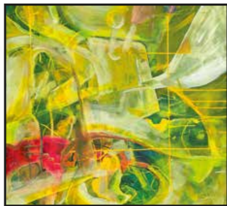
15 Rusa Trajkova: Slika, akril-platno, 100x100 cm, 2021., poklon autorice, 3.000,00 kn

Wrana je majstor suptilnih kolorističkih odnosa i fine stilizacije motiva, što je sve vidljivo i na ovoj nepretencioznoj kompoziciji čakovečkog slikara, keramičara i pedagoga.