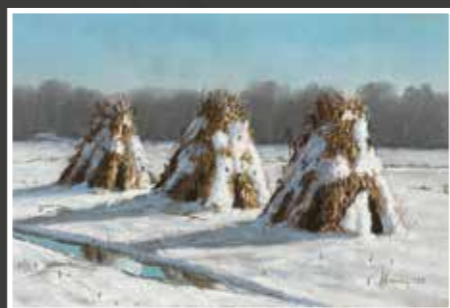
3 Zoran Homen: Zima u polju, pastel-papir, 31x49 cm, 2021., poklon autora, 2.000,00 kn Evo, odmah na početku, malog bisera ove aukcije: pastela slikara i bivšeg dugogodišnjeg ravnatelja križevačkog Muzeja, rada koji, kao i svaka njegova slika, zrači posebnom ugodajnošću i zavičajnim sentimentom, a ostvaren je sigurno, lako i likovno vrlo uvjerljivo.