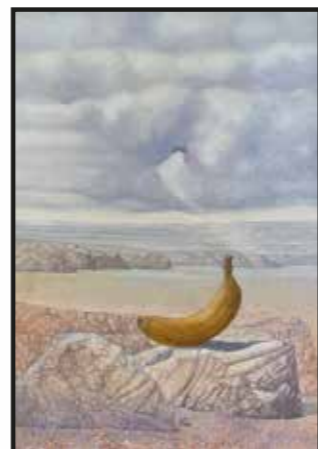
16 Marijan Štimac: Banana (po Magrittu), ulje-platno, 70x50 cm, poklon autora, 2.000,00 kn

Kao i prošle godine i ove je čakovečka umjetnica poklonila jedno veliko platno, s karakterističnim, slojevitim rukopisom, sliku u kojoj se izmjenjuju tihi, lirski fragmenti i energični, ekspresivni dijelovi.