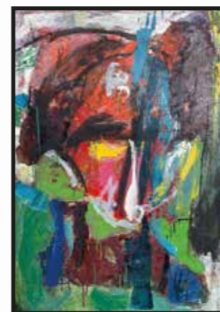
8 Tomislav Balažin: Apstrakcija, ulje-platno, 100x70 cm, oko 1990., 1.600,00 kn Kako nas je ovaj istaknuti koprivnički autor napustio već prije desetak godina, svaki susret s njegovim djelom iz stilski i motivski raznovrsna opusa zadovoljstvo je za sve ljubitelje umjetnosti. Posebno ako je riječ, kao u slučaju ove slike, o složenom i energičnom apstraktnom radu, manje zastupljenom u njegovu opusu.